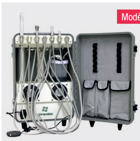
Modèle DU 852

Cette unité dentaire mobile est certifiée CE.