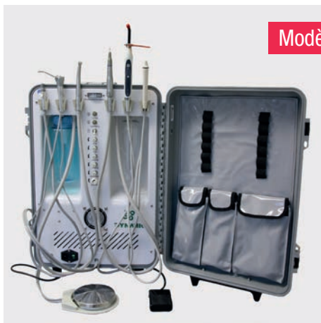
Modèle DU 893

Pour vous permettre plus de flexibilité en termes de prix, de poids et de caractéristiques techniques, action medeor propose deux modèles différents d'unités dentaires mobiles :